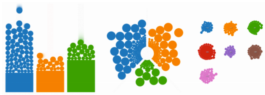
Figure 1. La sédimentation visuelle appliquée au diagramme en bâton à gauche, à un diagramme en camembert au centre et à un « bubble chart » à droite.

La sédimentation visuelle est une technique inspirée du processus physique de la sédimentation. Ce processus est le résultat de roches qui chutent, puis s'entassent en couches et se sédimentent au fur et à mesure du temps. Dans Visual Sedimentation nous appliquons cette analogie à des flux de données numériques. Les flux de données continus sont d'abord découpés en éléments discrets. Puis chaque élément est associé à un jeton (éléments graphiques). Chaque jeton est alors affiché à l'écran, il est soumis à une simulation des forces physiques comme celles de la gravité et du magnétisme. A la fin de leur chute, les jetons s'empilent en formant un tas, dans lequel ils s'agrègent en décroissant visuellement au fur et à mesure du temps. Au final, le tas de jeton se transforme en un diagramme classique comme un camembert ou un diagramme en bâton, dont la taille est mise à jour en fonction du nombre de jetons accumulés.